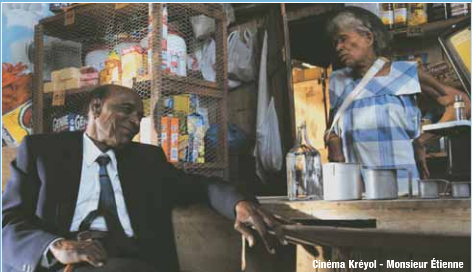
Cinéma Kréyol - Monsieur Étienne